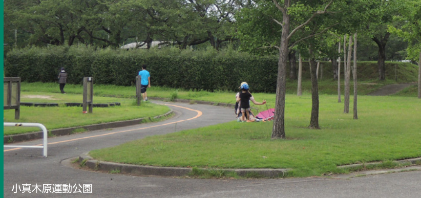
小真木原運動公園