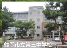
鶴岡市立第三中学校