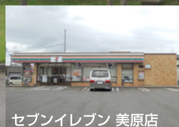
セブンイレブン 美原店